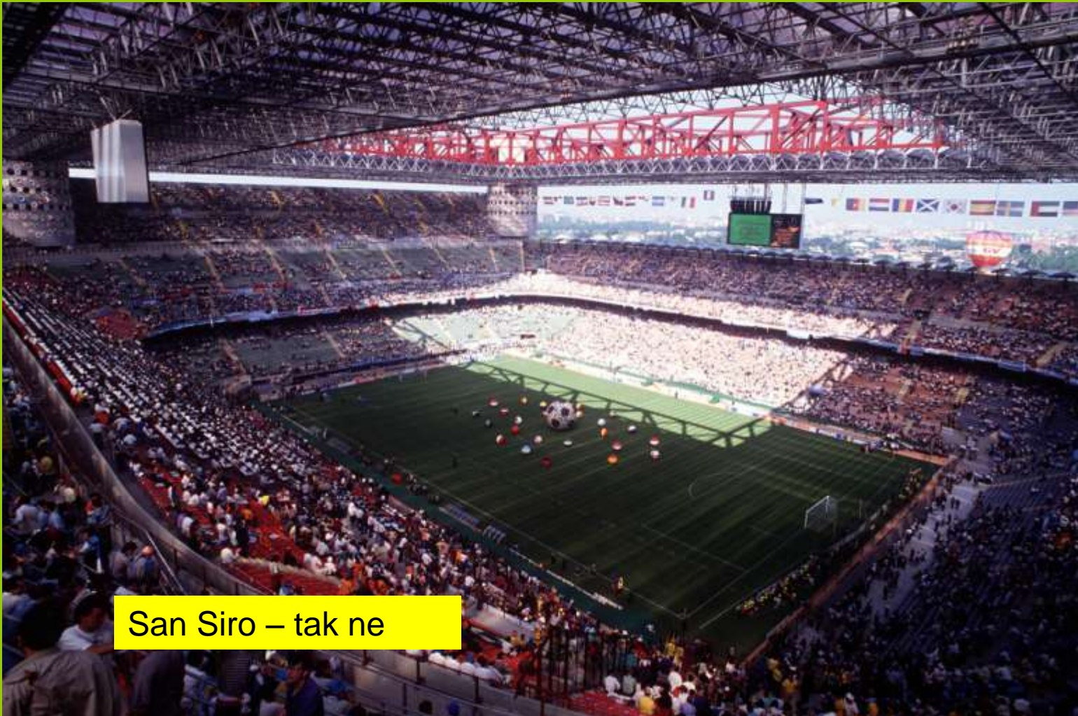
San Siro – tak ne